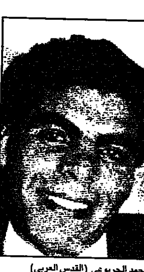
محمد الجريوعي (القديس العربي)